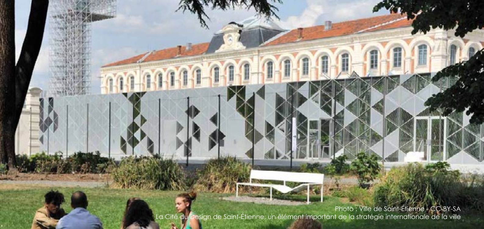
La Cité du Design de Saint-Étienne, un élément important de la stratégie internationale de la ville