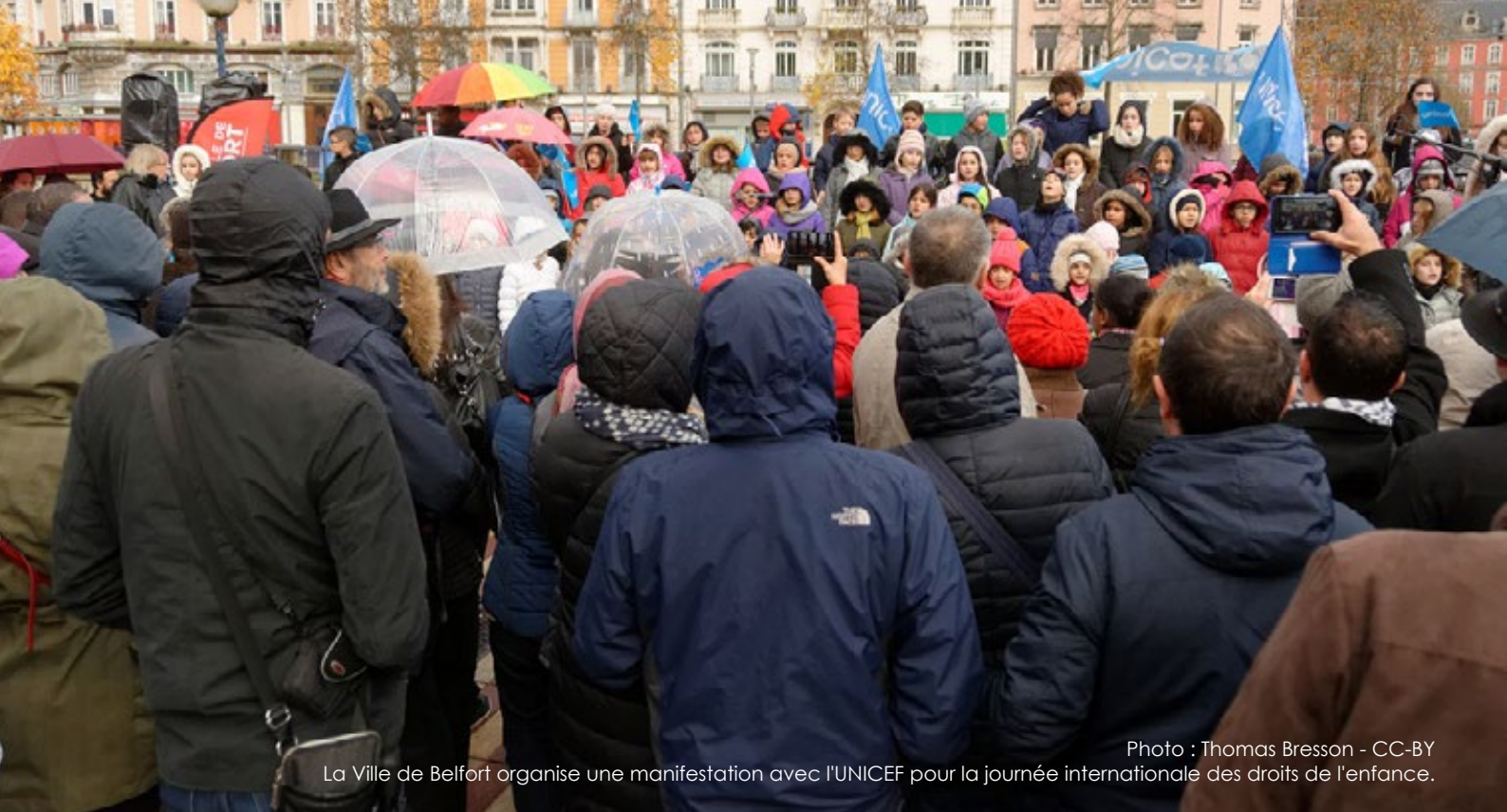
La Ville de Belfort organise une manifestation avec l'UNICEF pour la journée internationale des droits de l'enfance.