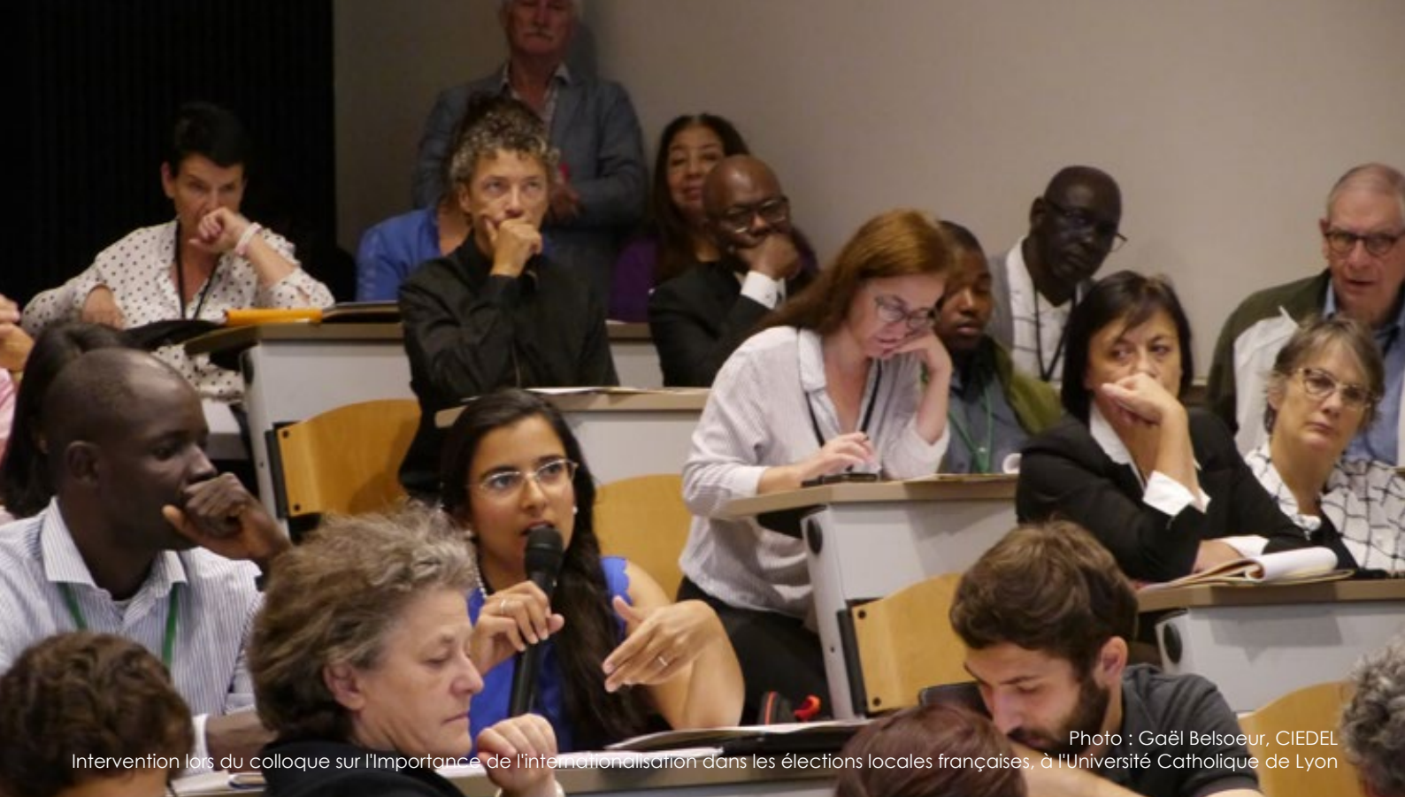
Intervention lors du colloque sur l'importance de l'internationalisation dans les élections locales françaises, à l'Université Catholique de Lyon