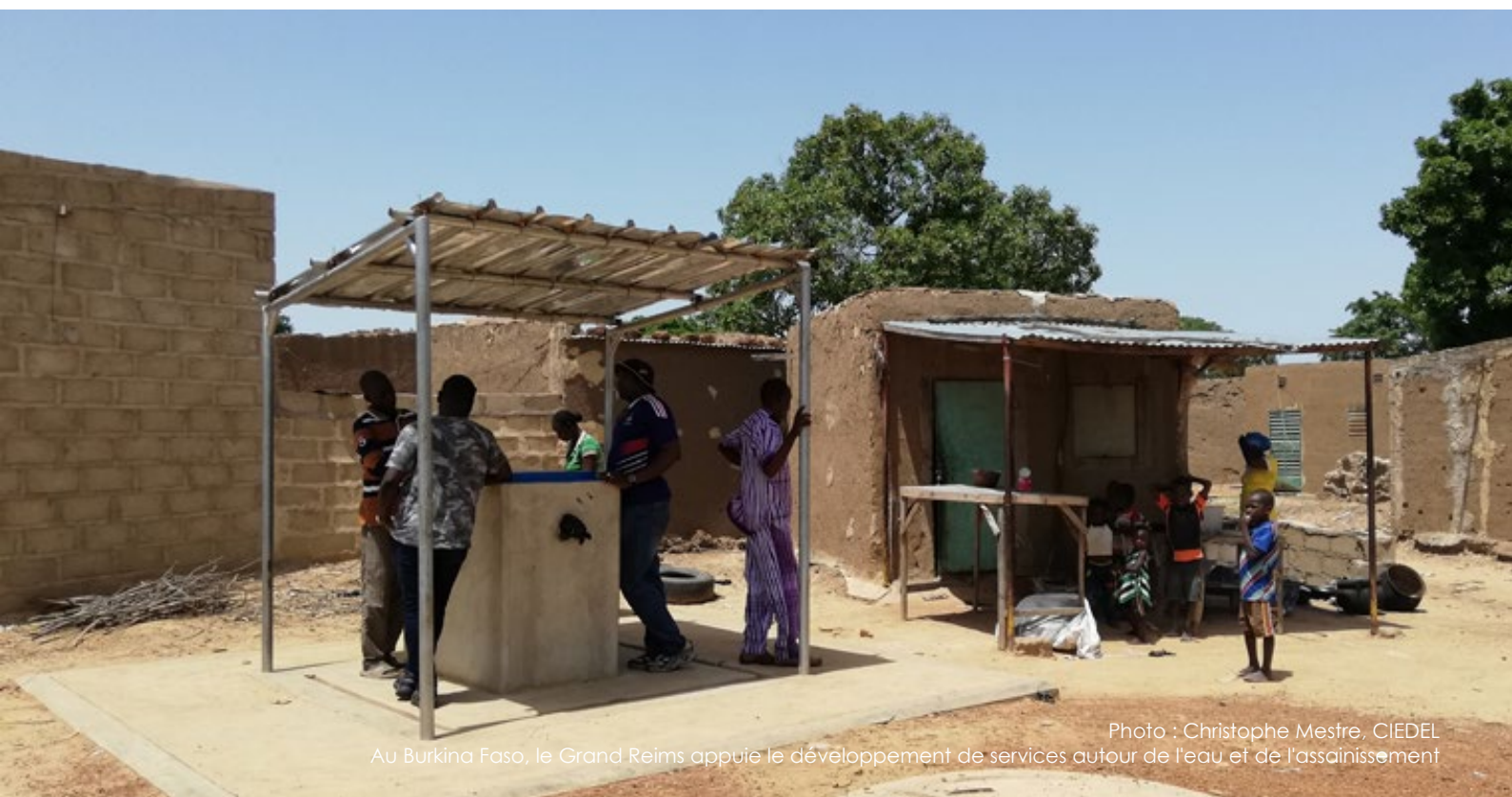
Au Burkina Faso, le Grand Reims appuie le développement de services autour de l'eau et de l'assainissement