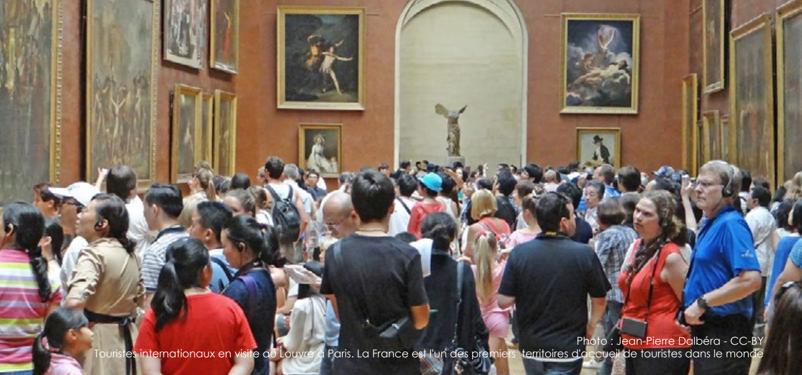
Touristes internationaux en visite au Louvre à Paris. La France est l'un des premiers territoires d'accueil de touristes dans le monde